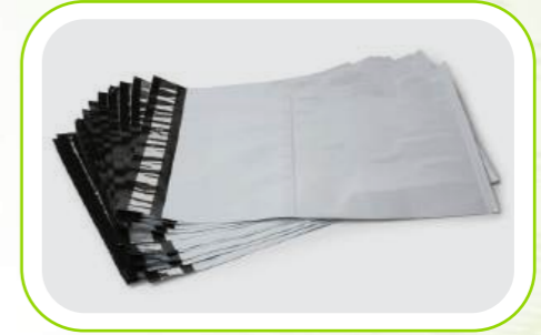
Kargo ve Kurye Torbaları Poly Mailers