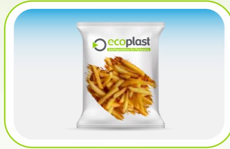
Dondurulmuş Gıda / Frozen Foods

Gıdaların uzun süre muhafazası için For long-term preservation of food