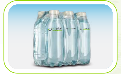
Shrink Film / Shrink Films