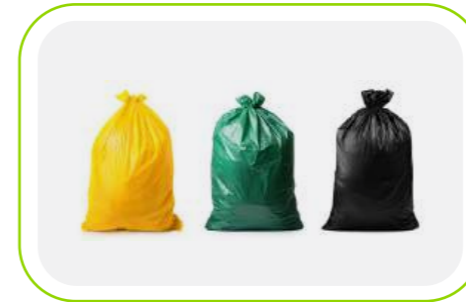
Çöp & Atık Torbaları Garbage Bags