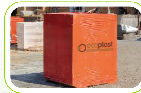
Palet Örtüsü Pallet Cover