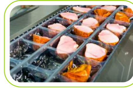
Termoform Film Thermoforming Films