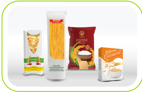
Makarna & Bakliyat / Pasta & Legumes