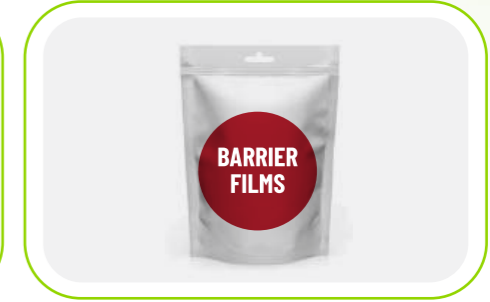
Bariyer Film Barrier Films