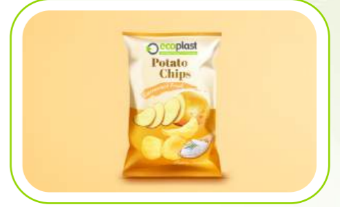
Bisküvi & Atıştırmalık / Snacks