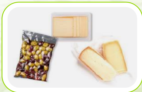
Süt Ürünleri / Dairy Products