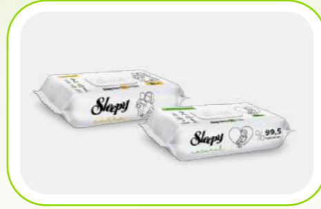
Islak Mendil Wet Wipes