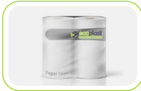
Peçete ve Kağıt Havlu / Tissue