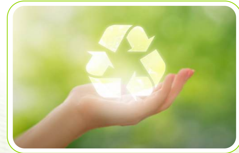
Geri dönüşüm / Recycling