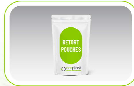
Retort Ambalaj Retort Package