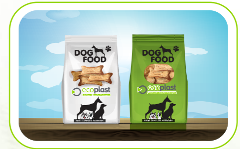
Pet Food Ambalajı Pet food packaging