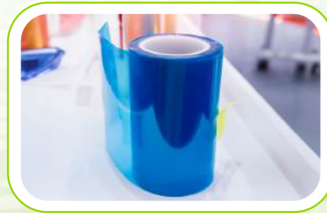
Medical Filmler Medical Films