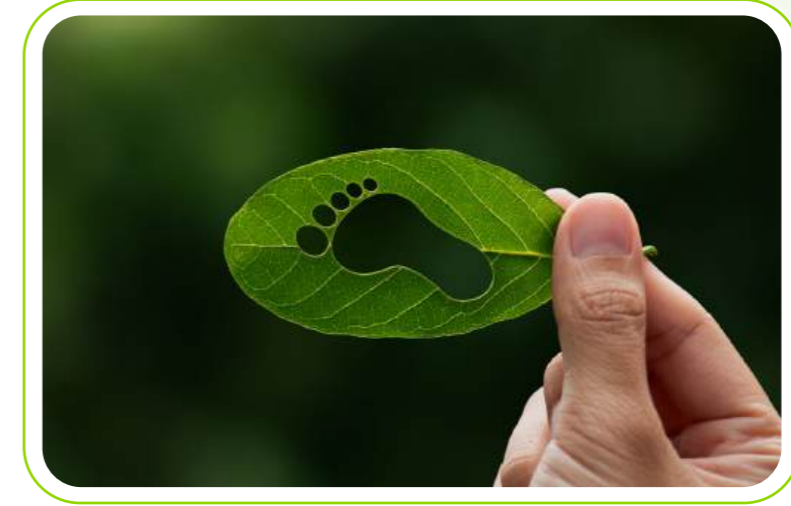
Karbon ayak izi ölçümü / Carbon footprint measurement