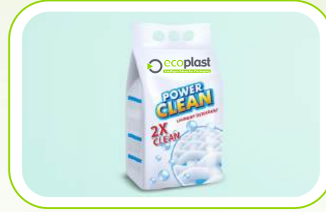
Deterjan & Temizlik Malzemeleri Detergent & Cleaning Materials

Personal care & medical and hygiene products