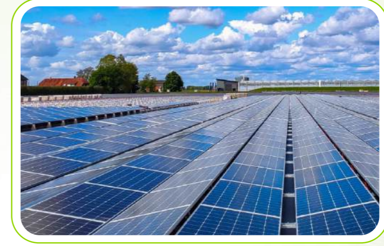
Yenilenebilir Enerji Sistemleri/Renewable Energy Systems

Recycling: We know the importance and value of recycling in reducing carbon footprint emission value, and we pursue our goals of becoming an authorized and certified organization in this regard.