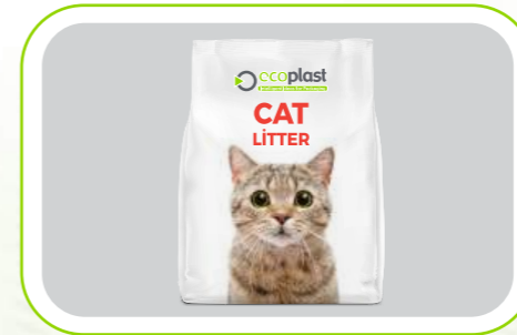
Kedi Kumu Ambalajı Cat litter packaging