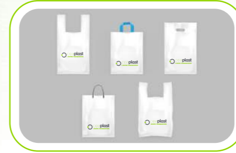
Yumuşak Kulplu Torba Softloop Bags