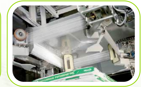
Streç Kaplama Stretch Hood