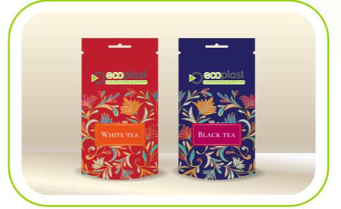
Kahve, Çay & Toz İçecekler / Coffee, Tea & Powdered Drinks