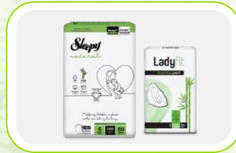
Bebek Bezi & Hijyenik Ped Baby Diapers & Hygienic Peds