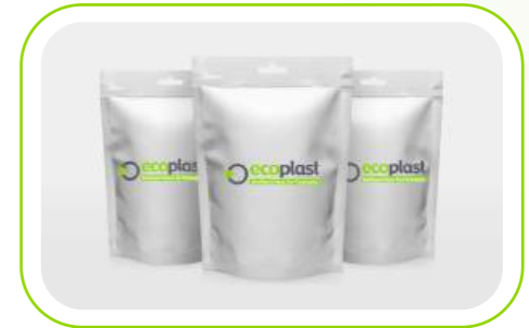
Doypack Ambalajlar Doypacks