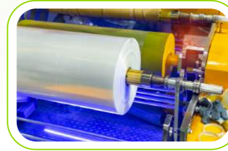
Laminasyon Filmleri Lamination Films