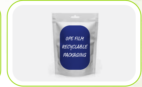
Ope Film Ope Films