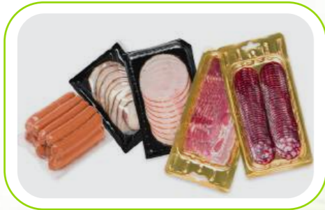
Et ve Balık / Meat And Fish