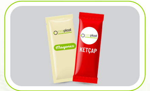
Ketçap, Mayonez ve Sos Ambalajları Ketchup, mayonnaise and sauce packaging